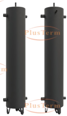
NB 01 NB 10